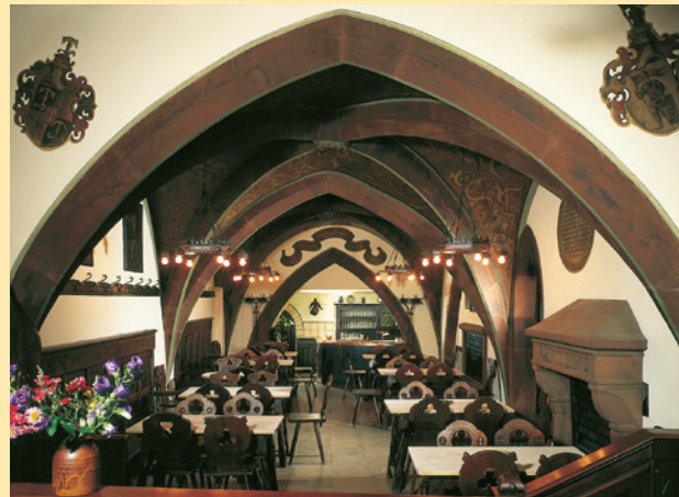
Dominikanerklause mit gotischem Gewölbe aus dem Jahre 1310

Ob Frühschoppen, Brotzeit, Mittagessen, Vesper oder abendliche Einkehr – die Gästeschar ist, frei nach dem Herrn Geheimrat Goethe, ein „bunt Gewimmel“ aus Männlein und Weiblein verschiedenster Couleur. Dem Dichter des „Faust“ könnte der Ausruf seines Titelhelden „Das ist des Volkes wahrer Himmel, hier bin ich Mensch, hier darf ich's sein!“ im Schlenkerla eingefallen sein.